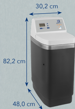
Ökosoft 60G VVS nr. 398822160