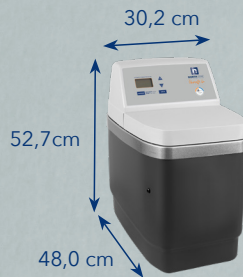
Ökosoft 25G VVS nr. 398822125