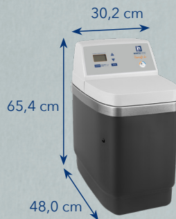
Ökosoft 35G VVS nr. 398822135